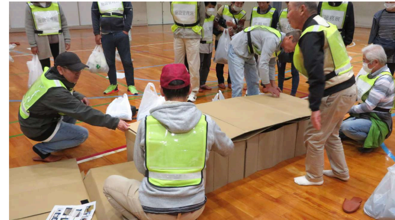
自治会の防災担当者が集まり段ボールベッドや簡易テントの設置・片付けの訓練

In preparation for fires, conducted drill to experience the fear of losing vision completely in a smoke-filled tent.