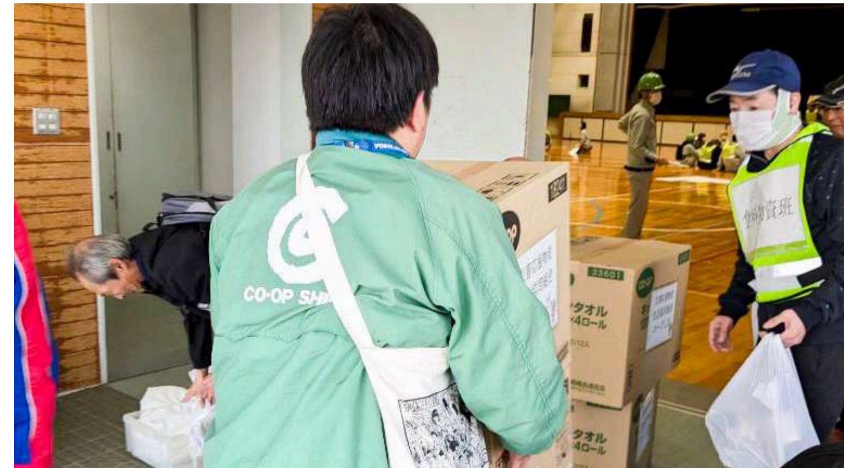
災害連携協定先からの支援物資の搬入受入訓練

Relief supply delivery training with partnering company under disaster cooperation agreement