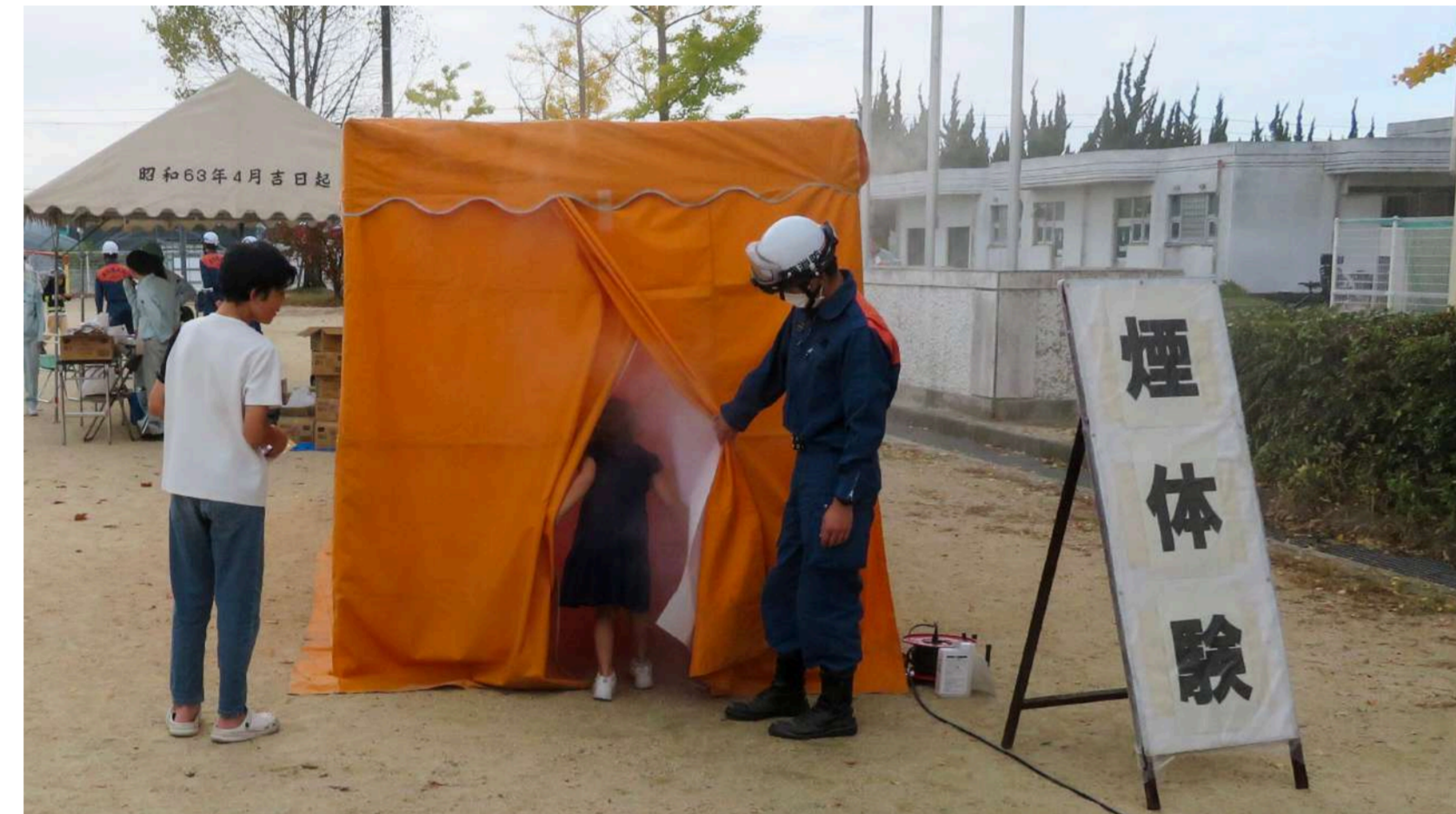
火災などに備え、煙中体験で極端に視野がなくなる恐怖を体験しておく

Relief supply delivery training with partnering company under disaster cooperation agreement