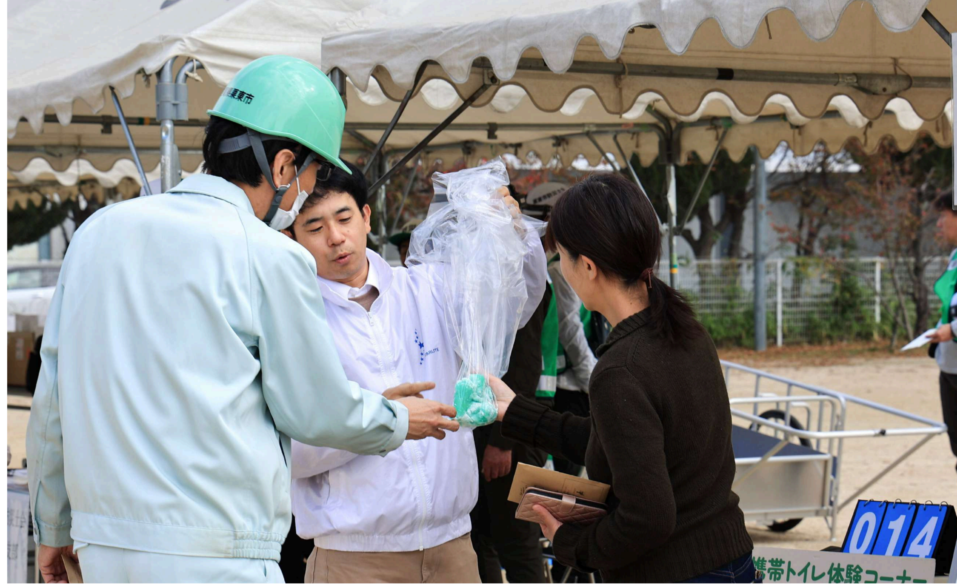
携帯トイレの体験をきっかけに災害時への備えを改めて考えてみる The use of a toilet kit encourages people to think about how to prepare for disasters.

訓練内容：段ボールベッド・簡易テント設置片付け、災害支援物資搬入受入訓練、煙中体験、水消火器体験、防火衣装着、物資運び出し、避難所開設受入・携帯トイレ凝固体験 日時：2024/11/17(日) 9:00-11:30 会場：大宝西小学校 参加機関：関西電力送配電(株)、(株)湖光ファイン、湖南広域消防局中消防署、生活協同組合コープしが、栗東市防災士会大宝西支部、スターライト工業(株)