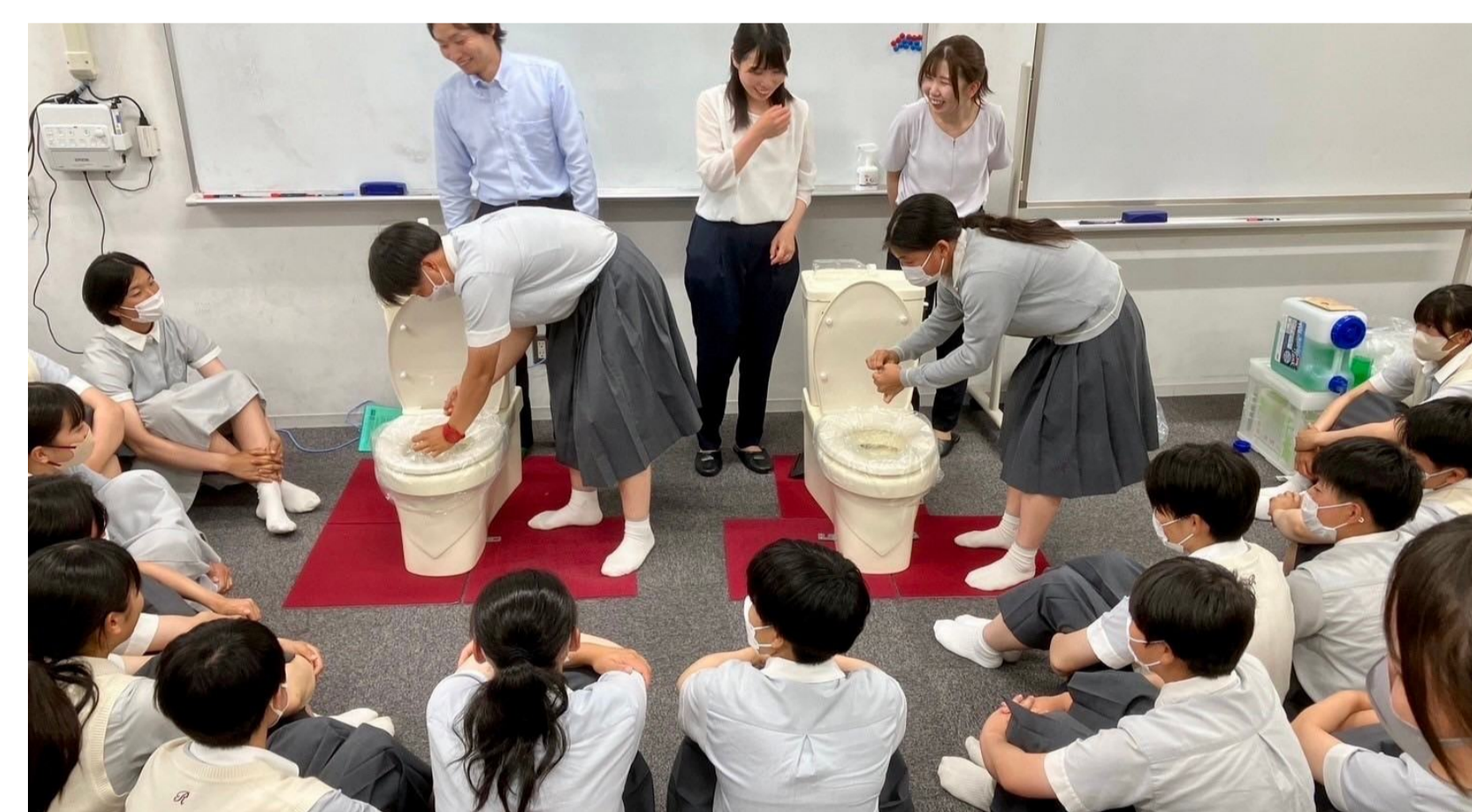
洋式トイレ便座が置かれた普段と違う雰囲気の中で新しいことにもチャレンジ

They learned about toilet-related issues in affected areas and began to think about the issues as their own matter.