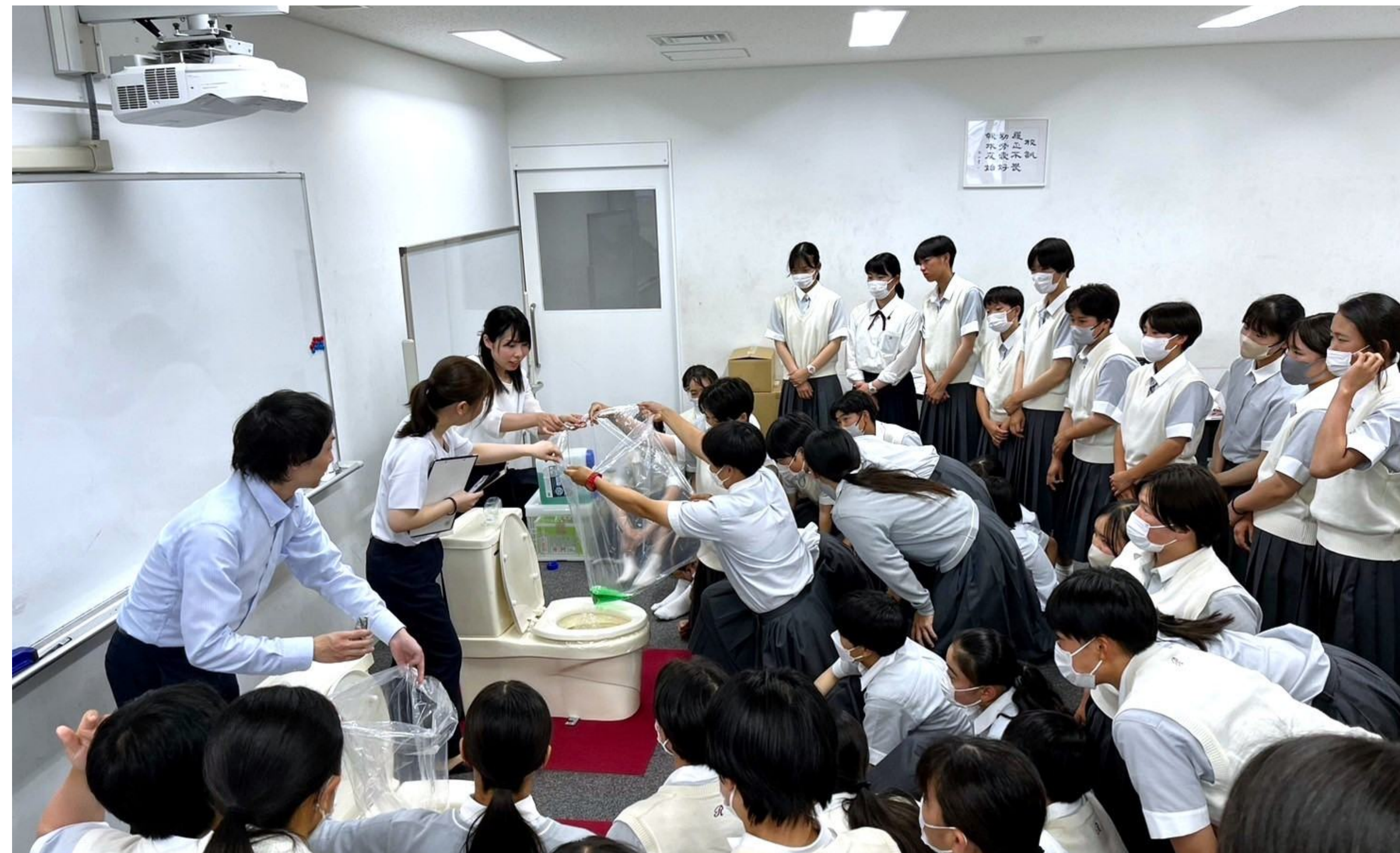
部員全員で携帯トイレの凝固体験に挑戦してみる！ All members had a chance to experience coagulating toilet kit powder.

活動内容 ・災害時のトイレ問題を学び自分ごととして理解し非常時に備える ・自ら体験したことを友人や家族など周囲とも共有する