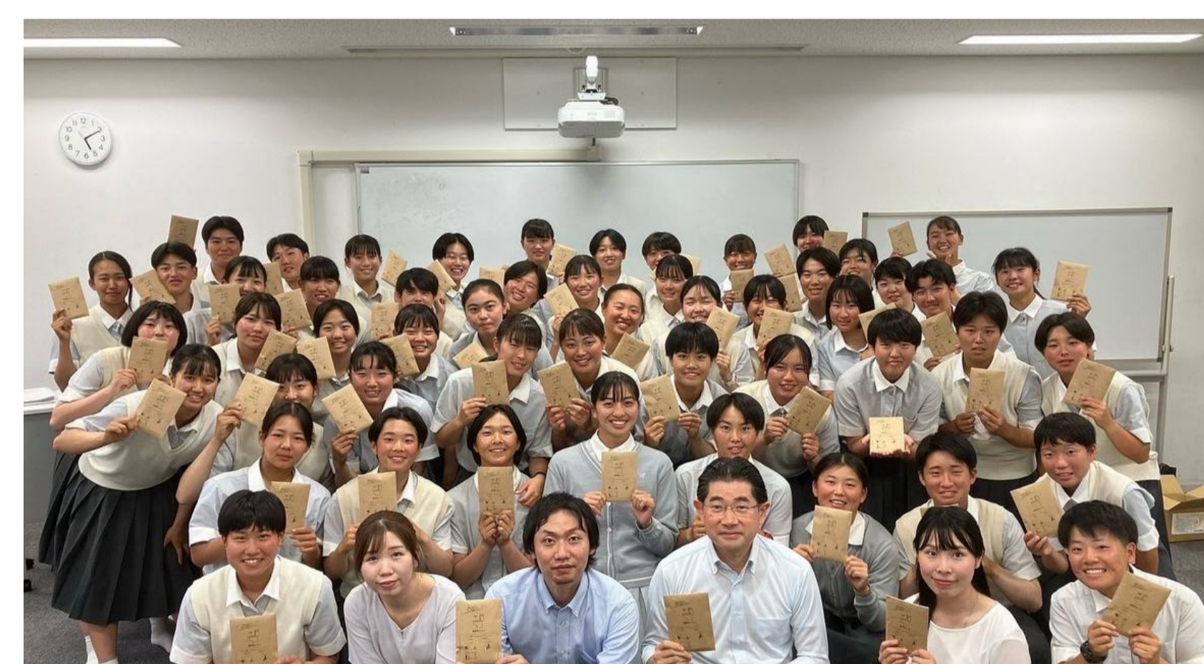
携帯トイレのサンプルを全員が持ち帰り自宅で実際に使ってみる

With toilet bowls in classroom, they had a new challenge.