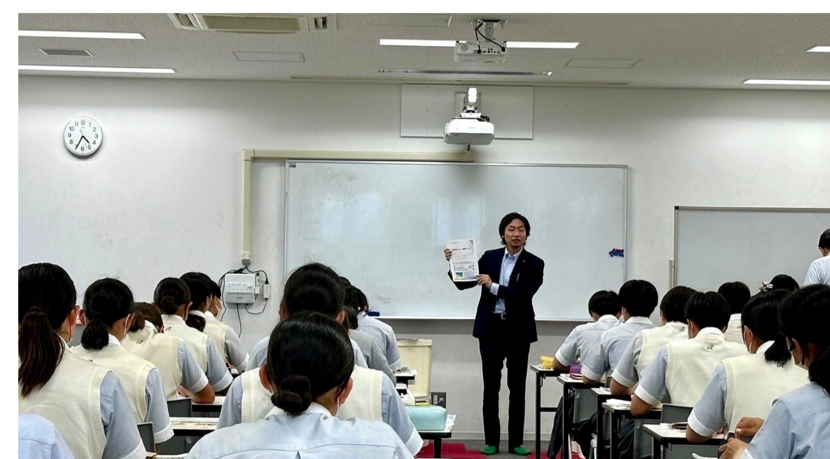
災害被災地でおきたトイレ問題を知り、災害時のトイレ問題を自分事として考える

They learned about toilet-related issues in affected areas and began to think about the issues as their own matter.