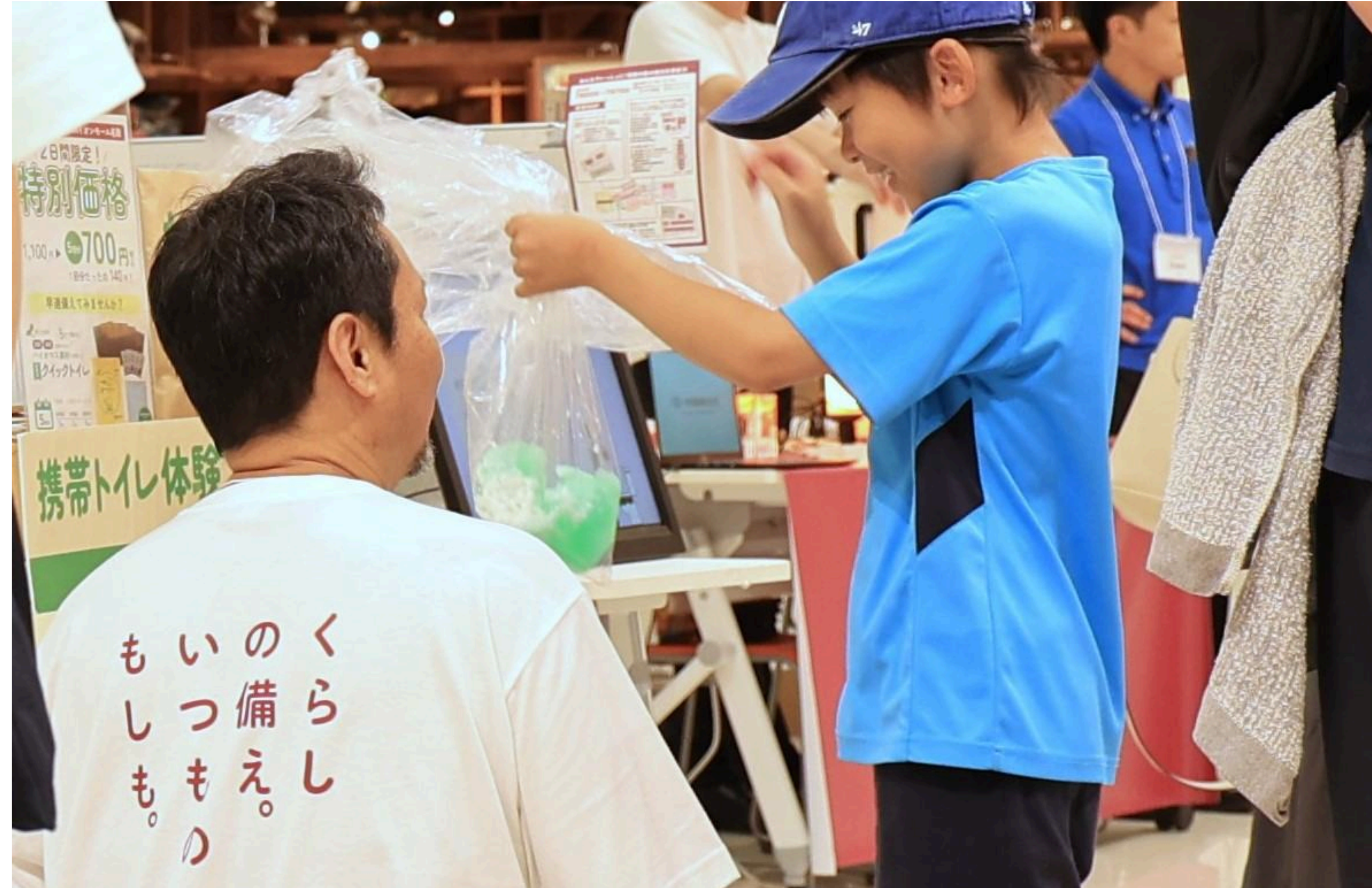
携帯トイレの凝固体験を通して、災害時のトイレ問題を学び・備えておく Learn about possible toilet-related issues that may arise during a disaster and be prepared.