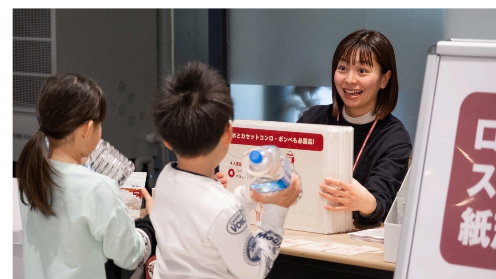
紙芝居を使って防災への備えの大切さを伝える

Held event for parents and children to think about toilets in times of disaster.