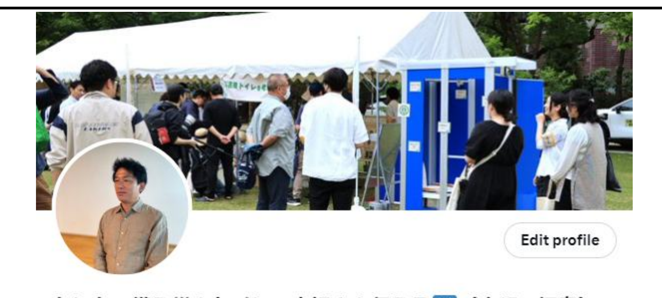
もしもに備え災害トイレの大切さを伝える (広報・福助) @starlite

X (旧Twitter) の「もしもに備え災害トイレの大切さを伝える」アカウントでは、いざという時に役立つ災害トイレのことを厳選してわかりやすく発信しています。フォローといいねをお願いいたします。