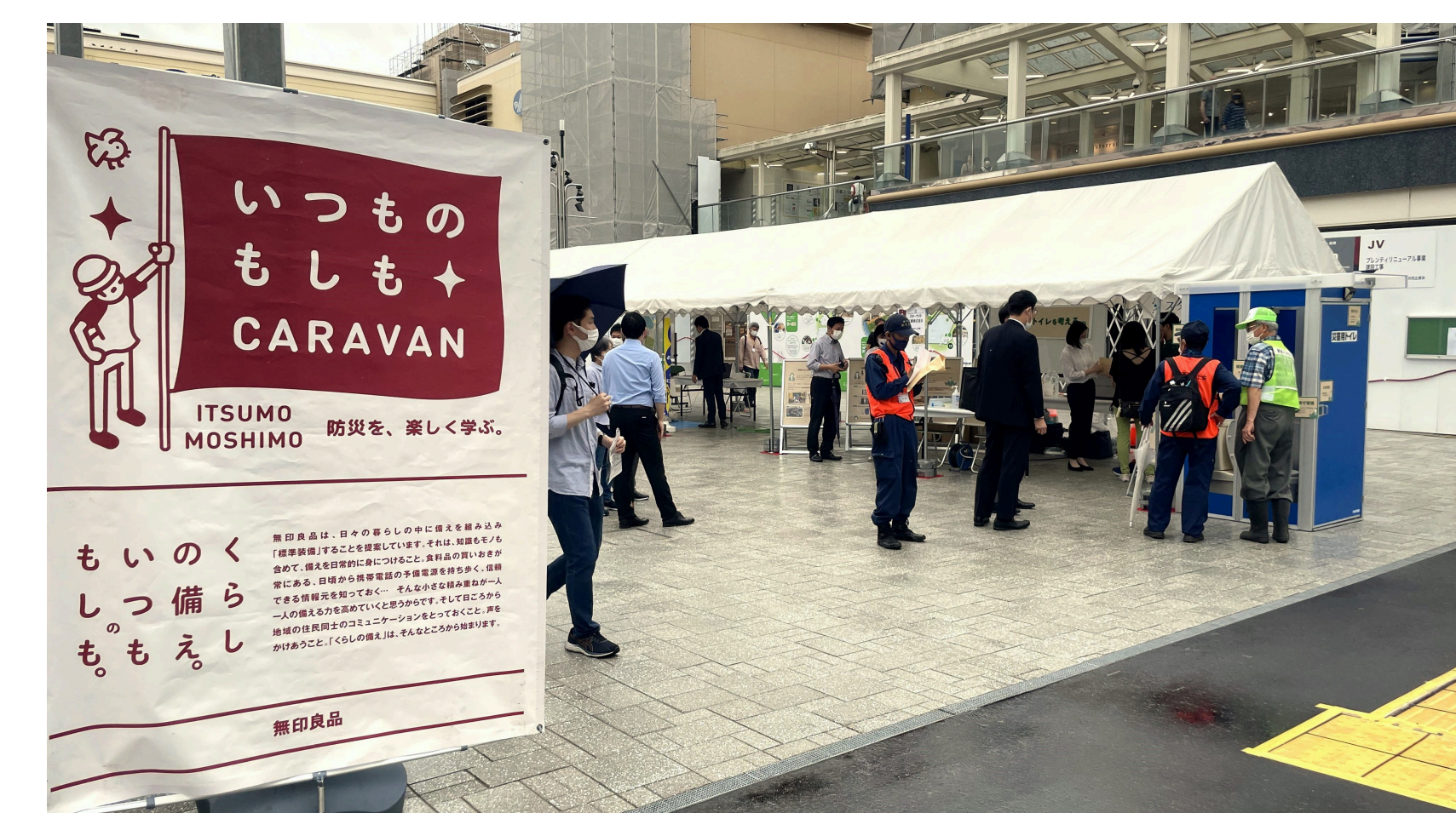
防災訓練の一環として地元自治会や消防団へ災害用トイレの備えを啓発

As part of emergency drills, enlightened local community associations and volunteer fire corps about stockpiling emergency toilets.