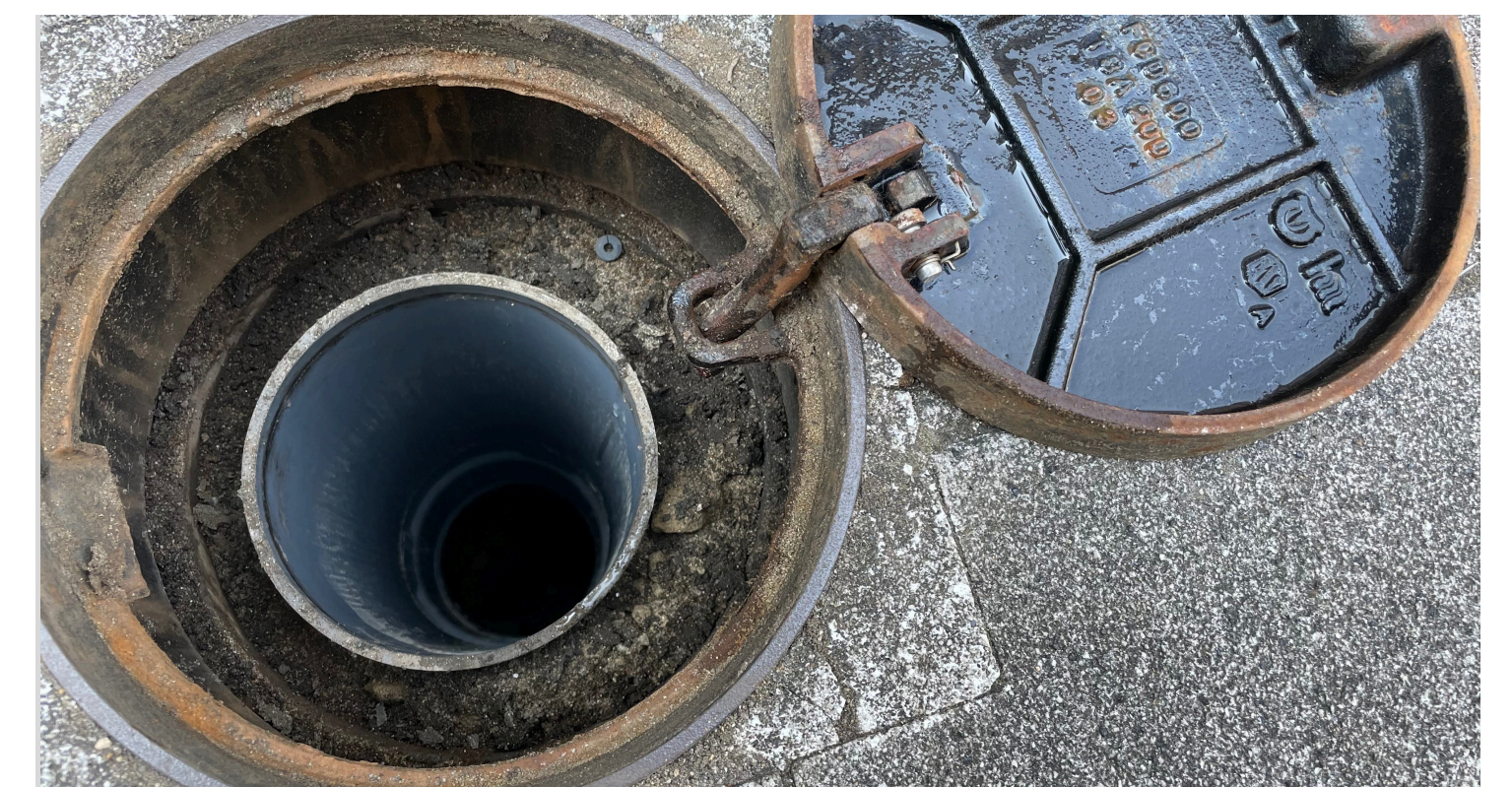
マンホールの蓋を開け雨水が溜まってないことを確認

Use and restock the toilet kits before the expiration date.