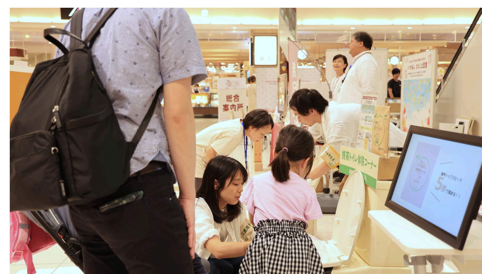
大型ショッピングセンターで災害時のトイレについて親子で考えるイベントを開催

As part of emergency drills, enlightened local community associations and volunteer fire corps about stockpiling emergency toilets.